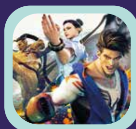
STREET FIGHTER 6