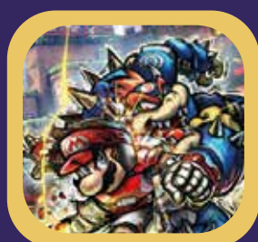
MARIO STRICKERS: BATTLE LEAGUE