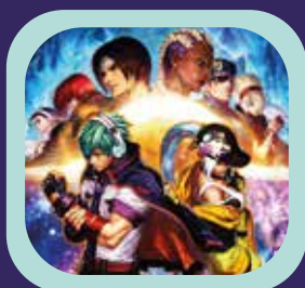
THE KING OF FIGHTERS XV