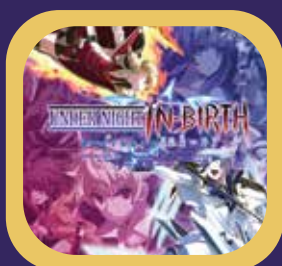
UNDER NIGHT IN-BIRTH EXE:LATE [CLR]