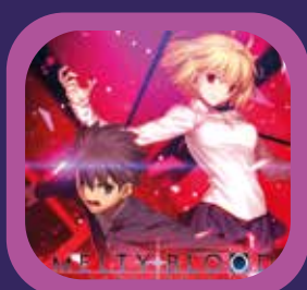
MELTY BLOOD TYPE LUMINA