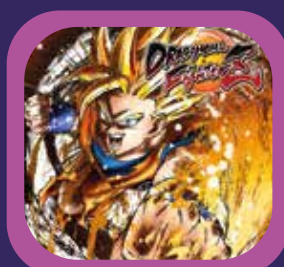
DRAGON BALL FIGHTER Z